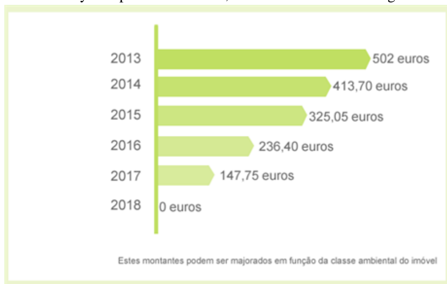
Figura 3. Posibilidades de deducción del arrendatario por rentas satisfechas.

Sin embargo, el régimen tributario tampoco es un factor que determine a una persona a alquilar en lugar de comprar una casa, porque la posibilidad de deducir el valor de las rentas pagadas al arrendador ha disminuido y desaparecerá en 2018, como se muestra en la Figura 3.